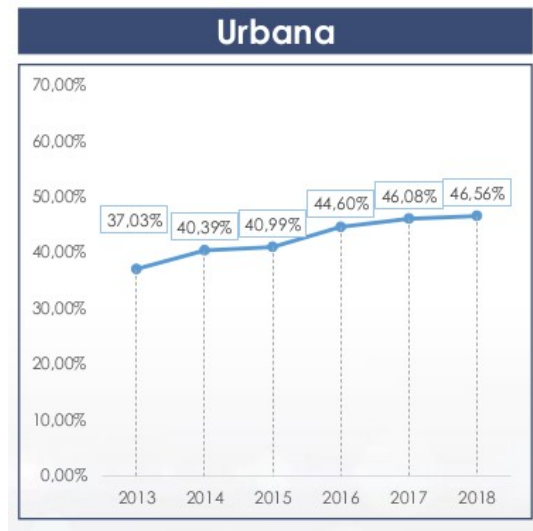
Figura 1. Encuesta Nacional Multipropósito INEC de hogares.

En Ecuador el 37.17% de la población tiene acceso a Internet, en el área urbana el porcentaje asciende a 46.56%, esto abre oportunidades para las marcas y sus productos/servicios.